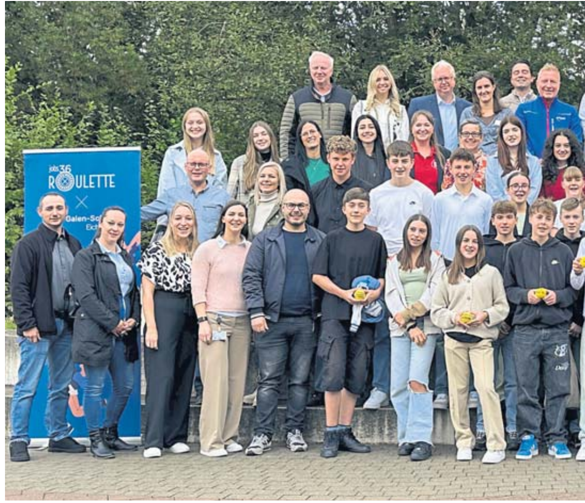
Deutschland-Premiere für „Job-Roulette – wir lassen uns darauf ein“ an der Von-Galen-Schule Eichenzell. Im Mittelpunkt: das Schulteam sowie dem Parzeller-Projektteam.